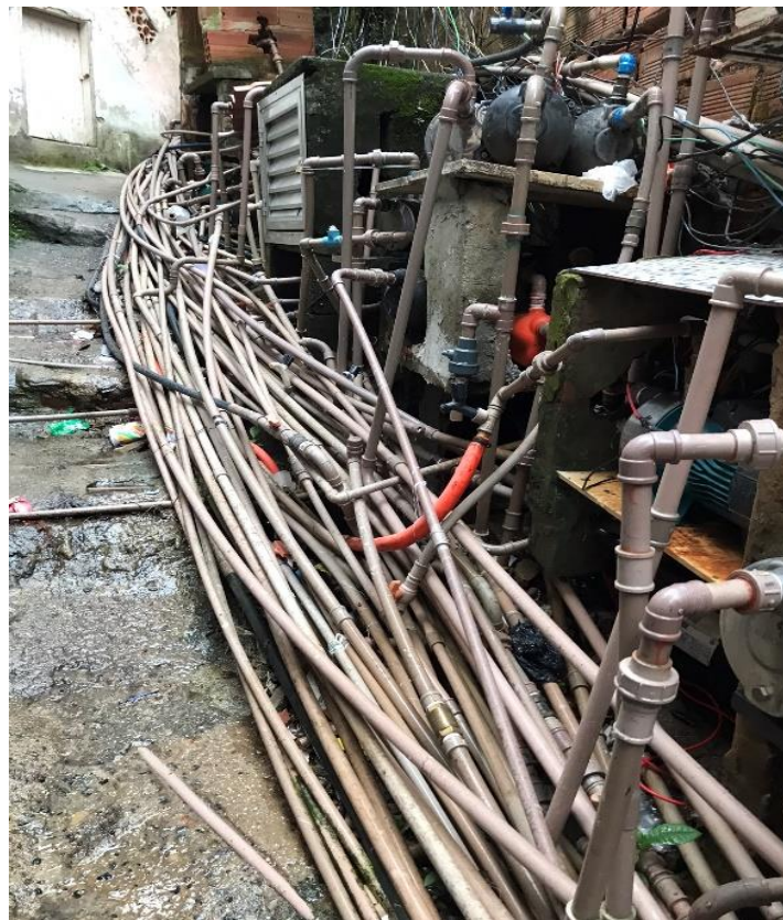
Ex: Sítio Pai João - Tubulações e bombas ao longo das vielas.